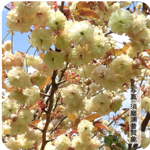
写真 須磨浦普賢家