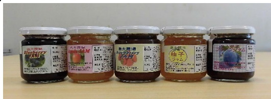
農場で栽培・加工した オリジナルジャム