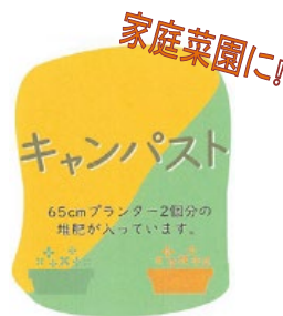
島根大学生協食堂の食品廃棄物から 作った有機質肥料です