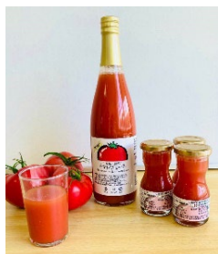
農場で栽培したトマトで作った 無塩のトマトジュース